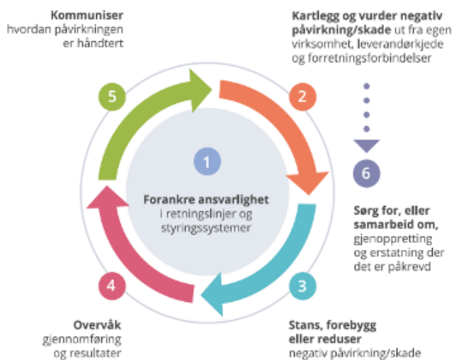
Figur 1: OECDs prosess for aktsomhetsvurderinger

Det er etablert rutiner som særskilt behandler våre plikter etter åpenhetsloven. Rutinene er forankret hos administrerende direktør/daglig leder i den respektive virksomhet, og ligger tilgjengelig i virksomhetenes styringssystem, som en ledelsesprosess. Rutinene er basert på OECDs modell for aktsomhetsvurderinger for ansvarlig næringsliv: