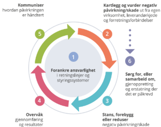
Figur 1: OECDs prosess for aktsomhetsvurderinger

Det er etablert rutiner som særskilt behandler våre plikter etter åpenhetsloven. Rutinene er forankret hos administrerende direktør/daglig leder i den respektive virksomhet, og ligger tilgjengelig i virksomhetenes styringssystem, som en ledelsesprosess. Rutinene er basert på OECDs modell for aktsomhetsvurderinger for ansvarlig næringsliv: