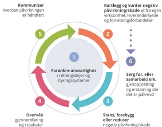
Figur 1: OECDs prosess for aktsomhetsvurderinger

Rutinene omfatter deling av ansvar og arbeidsoppgaver i vår virksomhet, kartlegging og vurdering av negativ påvirkning/skade i egen virksomhet, leverandørkjeder og forretningsforbindelser, samarbeid om gjenoppretting og erstatning der det er påkrevd, stansing/forebygging av negativ påvirkning/skade, overvåking av gjennomføring og resultater, samt kommunisering av hvordan påvirkningen er håndtert og behandling av informasjonskrav.