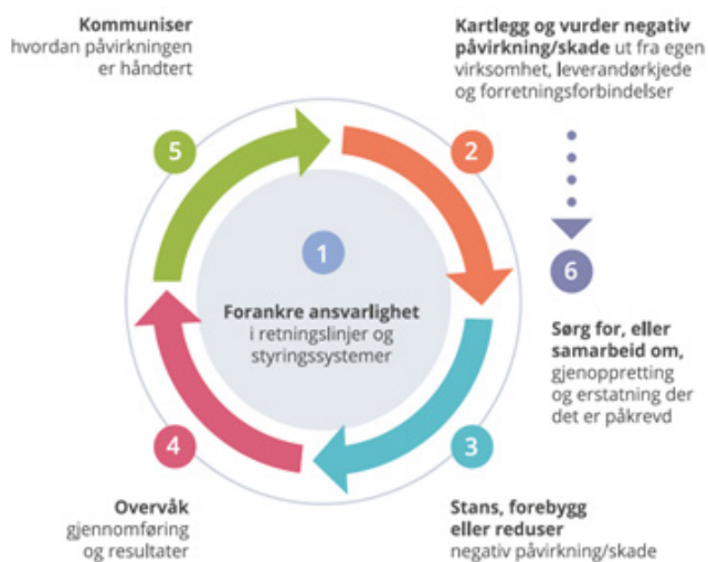
Figur 1: OECDs prosess for aktsomhetsvurderinger

ledelsesprosess. Rutinene er basert på OECDs modell for aktsomhetsvurderinger for ansvarlig næringsliv: